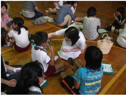
3年 親子で歯みがき！

6月21日（土）の自由参観会には、多くの保護者の皆様に御来校いただき、ありがとうございました。また、1～5年生では、PTA親子活動を実施いたしました。学年委員の方を中心に、事前の御準備、当日の運営につきまして感謝申し上げます。各学年、充実した活動が実施できました。