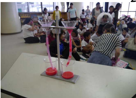
4年 生活習慣病って、何??