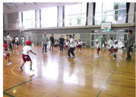
1年 親子でドッジボール