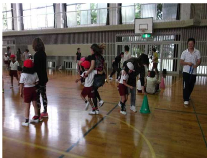
2年 二人三脚にチャレンジ！