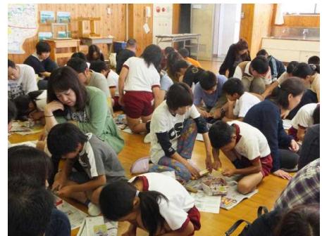
5年 小刀で鉛筆を削ろう！