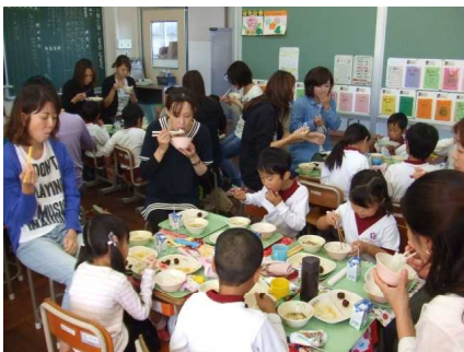
10/26 1年親子給食 親子活動後、もりもり食べました。