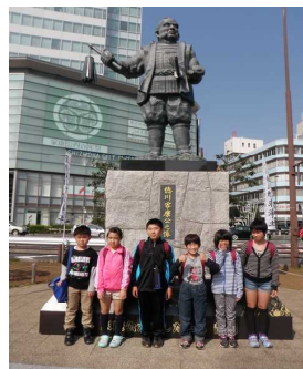
10/23 たんぽぽ校外学習 静岡市、家康公の前で...