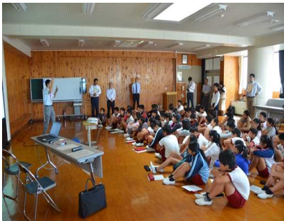
10/5 6年原子力防災講座 原子力について正しい知識 を学びました。