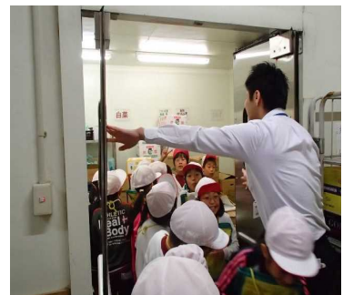
10/13 3年ベトナム見学 お店の工夫ってすごいな！