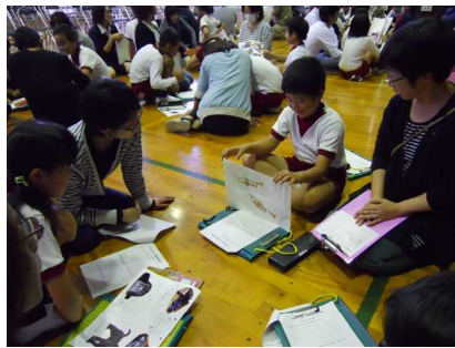
10/14 5年学校保健委員会 心の健康について WRAPってなあに??