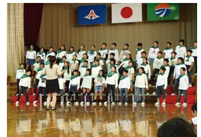
10/26 4年生を励ます会 ♪はじめの一步、風になりたい♪