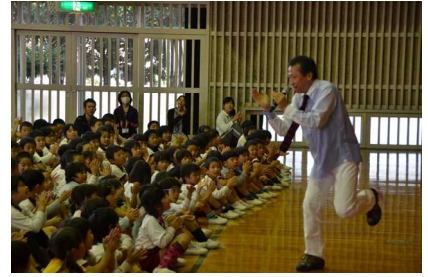
10/21 ユズリンコンサート 大盛りあがりでした！