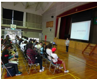
10/16 6年修学旅行説明会 さあ、東京に行くよ！ 小学校生活最後の親子活動でした。