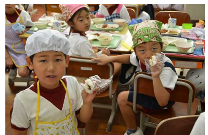
10/20 1年自作おにぎり試食 具は何が入ってるのかな？