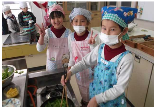
2年生 冬野菜を食べよう！ 自分で育てた野菜は、最高だ！