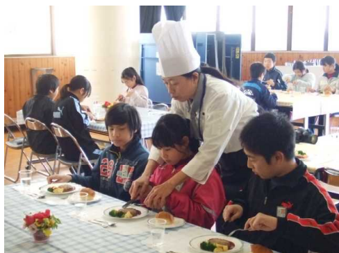
6年 テーブルマナー講習会 マナーは思いやりなんだな！