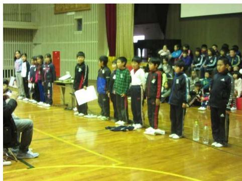
4年生 2分の1成人式 私たちは、こんなに成長したよ！