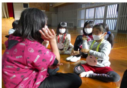
5年生 入学予定園児との交流 4月からよろしくね！私たちが来年の6年だよ！