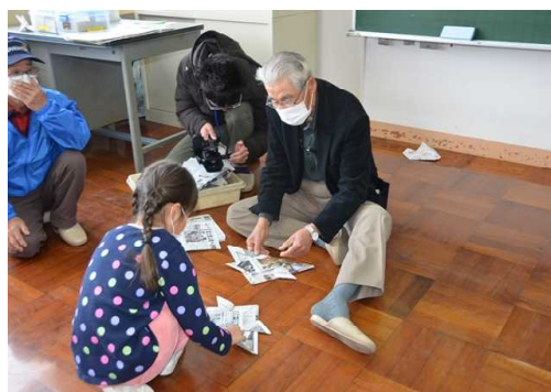
1年 昔の遊びを体験しよう 老人クラブの御指導のもとに・・・