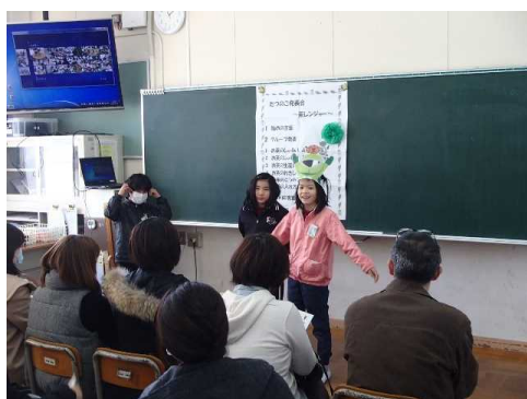
3年生 お茶学習発表会 歴史、効能なんでも聞いてください！