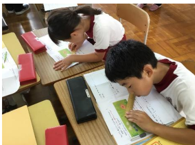
2年生 単元内自由進度学習