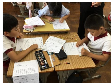
3年生 単元内自由進度学習