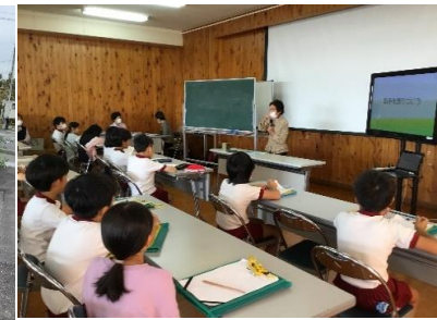
6年原子力発電所見学