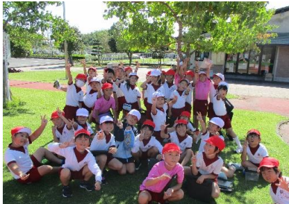
4年アースキッズチャレンジ