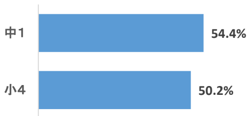
朝食で赤・黄、緑の食品が揃っていた割合

小笠地区学校保健会 令和4年度食生活アンケート結果より (対象：小4・中1 児童生徒 3175名回答)