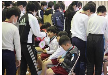
<一年生を迎える会> プレゼントをもらったよ！

昇降口は、朝7時40分に開きます。 早く来すぎないように集合・出発 の見直しをお願いします。早いところは 10分くらい昇降口前で待っています。